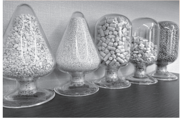
宮城県産ゼオライト