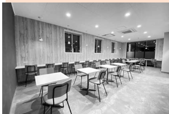
リフレッシュスペース