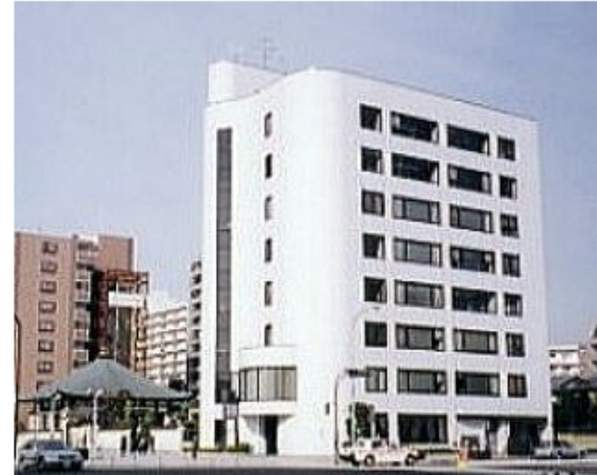
本社のあるサンライン第66ビル

大手メーカーの各種ソフトウェアの開発やデジタルコンテンツの制作を委託されるなかで、音声技術やコンピューター・グラフィック画像処理に特化した独自技術を培ってきた。その技術を生かし、音声データの音程と時間を自在に操れる音声処理技術「PHISYX」（特許出願中）ならびに音声処理ソフト「CHRONOSStream」を開発した。