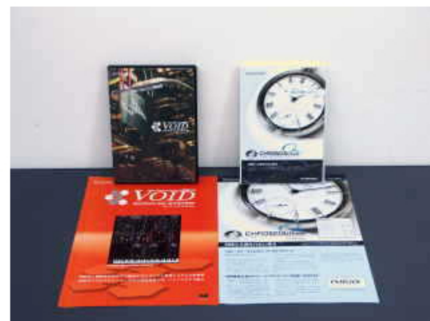
P SOFT オーディオソフトウェア