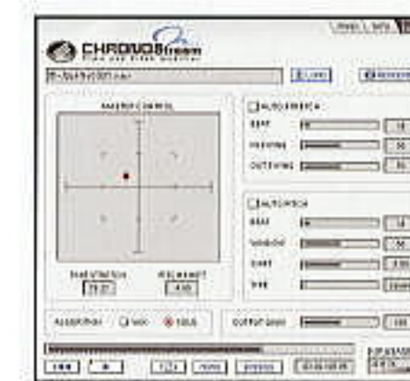
クロノストリーム操作画面

ソフトウェアシンセサイザー「VOID Modular System」やグラフィック用ソフトなど多彩な自社製品の開発にも成功。デジタルコンテンツ産業で活躍するクリエイターやアーティストの想像力を刺激し、自由な発想で新たな作品を創出させるための新しい表現の手法を今後とも提供していくことが大いに期待される企業である。