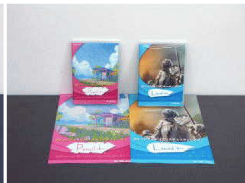
P SOFT ビジュアルソフトウェア