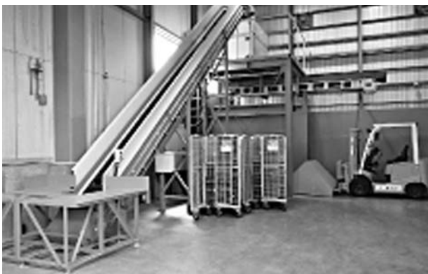
機密書類用破砕機

4つ目は、機密文書の回収・処理です。機密文書の処理というと、以前は焼却処理が一般的でした。しかし、個人情報の保護に関する法律の施行により機密文書の取り扱いが厳しくなったことや、仙台市の焼却工場へ機密書類を含む再生可能な紙類を持ち込めなくなったことを契機に、それらの紙資源の受け皿になろうと、この事業を開始しました。現在では、官公庁や銀行を始め一般企業など約1,000社と契約を結び、年間約3,000tの機密書類を処理しています。