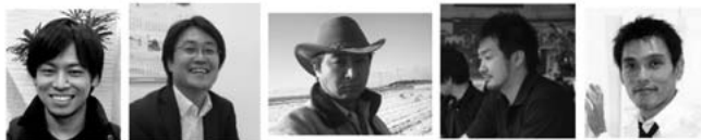
イチゴ産業復活！ 復興美容室の展開！ 農業×ITで復活！ 飲食業、福島から世界へ！ 伝統工芸を復活！