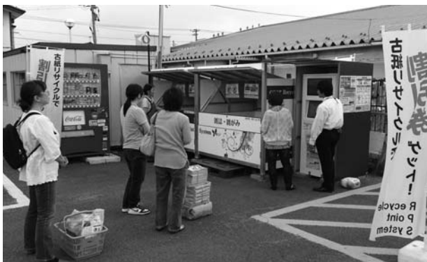
「古紙リサイクルポイントシステム」

実際に利用されたお客様からは、「買い物のついでに出すことができ便利」、「ポイントが付くことで楽しくリサイクル意識が高まる」といった声が寄せられています。中には「全店舗にシステムの設置を希望します」という嬉しいお言葉もいただいています。