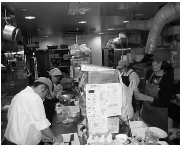
多くの「クルー」が働く厨房

『六丁目農園』は、障害者雇用施設として障害者を雇用し、訓練の一環として調理や接客を行っています。決してほかのレストランと比べて質が劣るわけではありません。料理・サービスの質がよいからこそ、多くのお客様に利用していただき、ランチのみの営業で月650~700万円の売上を計上しています。補助金に頼るだけではなく、事業としてきちんと収益を上げているからこそ、「クルー」への賃金も業界平均支給額を大きく上回る7万円以上を支給しています。