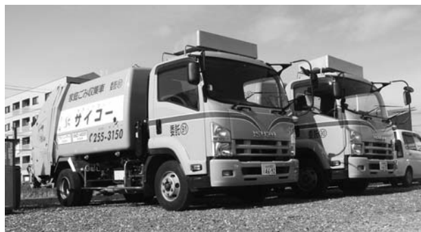
バックカー車（仙台市家庭ごみ回収車）

また、平成25年4月からは、仙台市の家庭ごみの回収業務にも取り組み始めました。仙台市の環境行政の一翼を担い、これまで以上に地域の環境保全に努めていきたいと考えています。