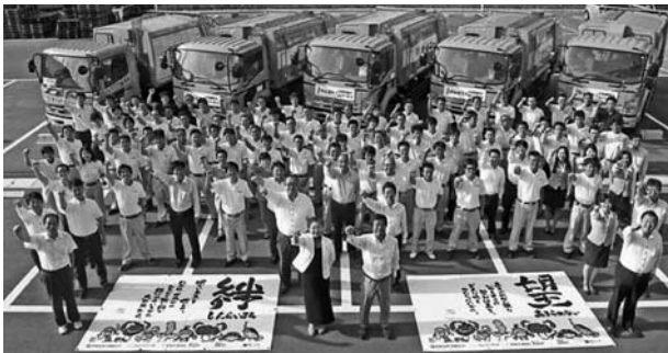
復興を誓う社員一同

震災を経験したからこそ、社員との絆が深まり、同業者やお客様との絆を再認識することができたのだと思います。今後も、東北の復興を願って事業に取り組んでいきたいと思っています。