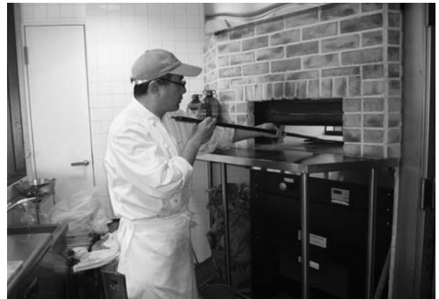
本格石釜ピッツァを焼くスタッフ

しかし、この場所に出店すると決めたとき、「こんな場所で営業しても繁盛するわけがない。絶対に無理だ。やめたほうがいい。」と周囲からは反対されました。反対を押し切って営業を開始しましたが、結果的には、このような辺鄙な場所で繁盛しているからこそ、より注目を集めることとなり、口コミでの集客に繋がったのだと思います。