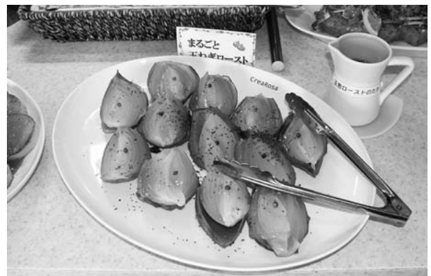
人気メニューの「まるごと玉ねぎロースト」

通常のビュッフェレストランでは料理が大きなお皿に山盛りにされていることが多いのですが、それでは料理が冷めてしまい、最後までおいしく食べて