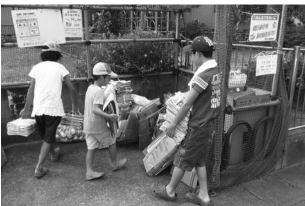
子供会による集団資源回収の様子

5つ目は、集団資源回収です。ゴミの減量化とリサイクル推進のため、子供会や町内会などの集団資源回収を行っています。回収品目は、新聞、雑誌、ダンボール、古布、牛乳パック、アルミ缶、ビン類