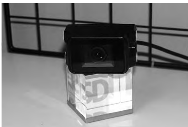
高感度 CCD カメラ

市場で安全性のニーズが高まる一方で、建設機械ではまだ浸透していない機能ですので、建設機械用の鳥瞰モニタシステムの開発は、当社の技術力を活かす絶好のチャンスだと考えています。当社製品であるCCDカメラ、モニターなどを使用するので、当社既存製品の拡販にもつながりますし、建設業界の安全性の向上にもつながる商品だと思います。