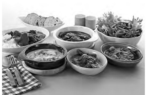
牛たんを使ったメニュー

向けに開発した商品で、今では人気メニューとなっていますが、牛たんにパンという発想は創業当時の20数年前では考えられなかったことです。当社商品は突拍子もない発想で生まれたものや全国をまわってヒントを得たものが多くあります。