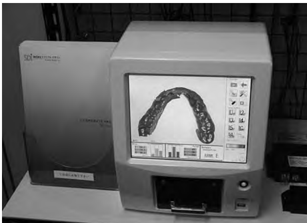
歯接触分析装置「Bite Eye BE-I」

現在、当社の売上の約8割以上が建設機械・農業機械向けの電装品の設計・製造となっており、事業の柱としては大きな柱が一本あるだけです。もう一つか二つビジネスの柱を構築したいと考えておりました。医療関係の仕事は景気に左右されにくいとされていますし、日本の高齢化社会の進展により需要は増加すると思いますので、徐々に参入していきたいと考えています。