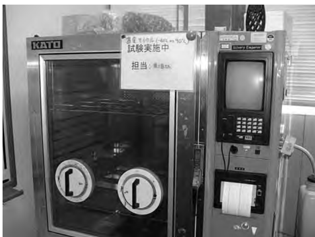
温度環境評価実験装置

また当社は、工場を所有しない、いわゆるファブレス企業ですが、製造は業務提携を結んでいるパートナー企業の工場へ委託することで、設計から製造までの一貫体制を構築しています。