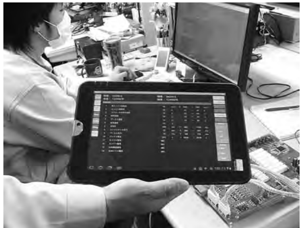
アンドロイドタブレット用アプリケーション

世の中の最先端技術ばかりを使用することが全てのお客様に喜ばれることではないと思っています。最先端の技術を導入してもお客様のニーズに合わなければ商品として意味はありません。常にお客様に喜ばれる製品を企画し、使いやすく、安全で、楽しめる製品を世の中のトレンドを見ながら開発していきたいと考えています。