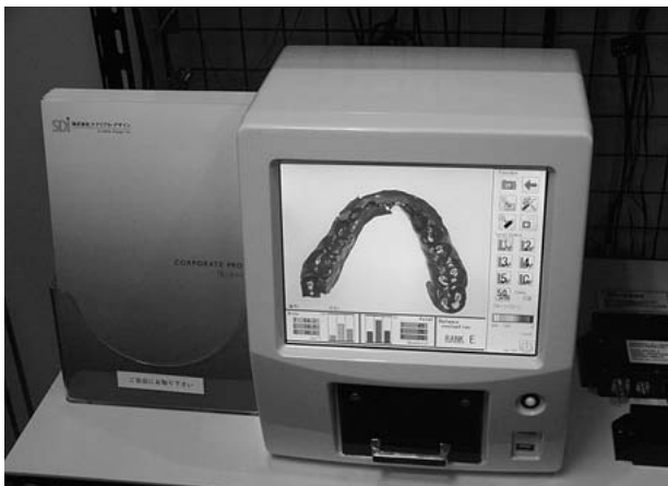
歯接触分析装置「Bite Eye BE-I」

現在、当社の売上の約8割以上が建設機械・農業機械向けの電装品の設計・製造となっており、事業の柱としては大きな柱が一本あるだけです。もう一つか二つビジネスの柱を構築したいと考えておりました。医療関係の仕事は景気に左右されにくいとされていますし、日本の高齢化社会の進展により需要は増加すると思いますので、徐々に参入していきたいと考えています。