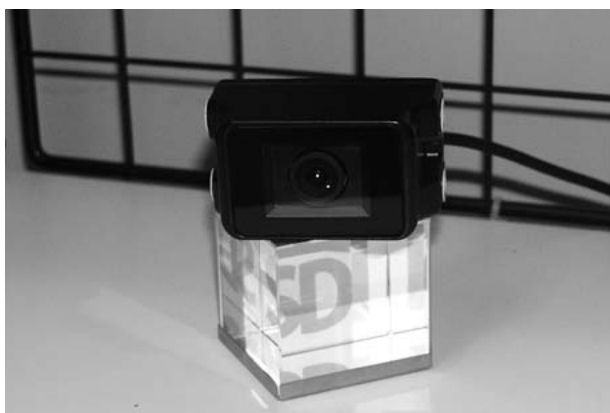
高感度 CCD カメラ

市場で安全性のニーズが高まる一方で、建設機械ではまだ浸透していない機能ですので、建設機械用の鳥瞰モニタシステムの開発は、当社の技術力を活かす絶好のチャンスだと考えています。当社製品であるCCDカメラ、モニターなどを使用するので、当社既存製品の拡販にもつながりますし、建設業界の安全性の向上にもつながる商品だと思います。