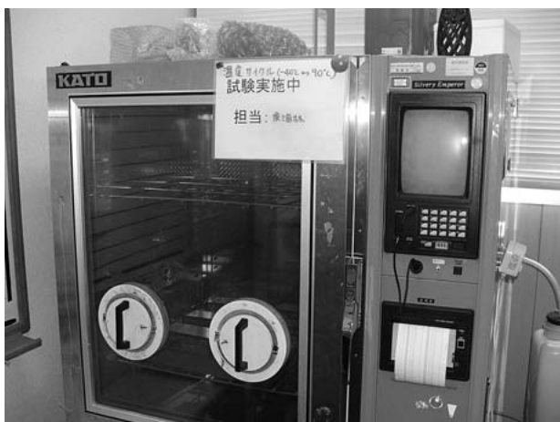
温度環境評価実験装置

また当社は、工場を所有しない、いわゆるファブレス企業ですが、製造は業務提携を結んでいるパートナー企業の工場へ委託することで、設計から製造までの一貫体制を構築しています。