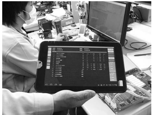
アンドロイドタブレット用アプリケーション

世の中の最先端技術ばかりを使用することが全てのお客様に喜ばれることではないと思っています。最先端の技術を導入してもお客様のニーズに合わなければ商品として意味はありません。常にお客様に喜ばれる製品を企画し、使いやすく、安全で、楽しめる製品を世の中のトレンドを見ながら開発していきたいと考えています。