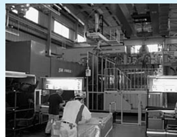
大型射出成形現場