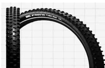
マウンテンバイクタイヤ