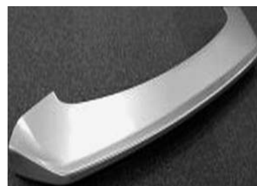
外装用成形塗装品