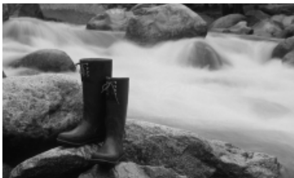
「バーバリアンチーフテン」