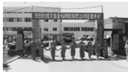
大連金弘橡胶（ゴム）有限公司