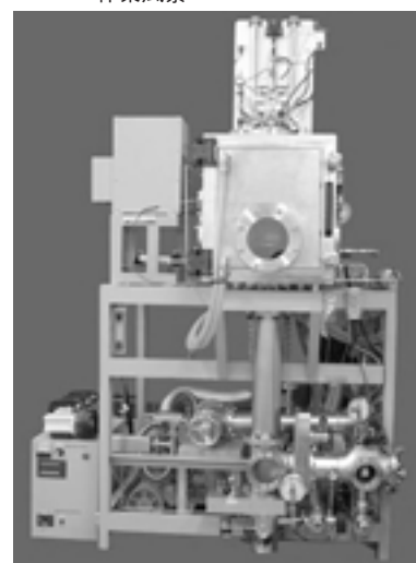
高精度マイクロボール作製装置