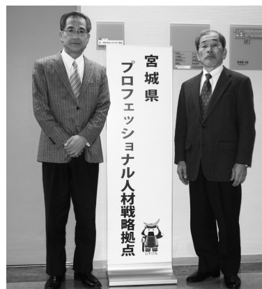
「宮城県プロフェッショナル人材戦略拠点」

求めている人材とは、新たな商品・サービスの開発、その販売の開拓や、個々のサービスの生産性向上などの具体的な取り組みを通じて、企業の成長戦略を具現化してくれる人材だと思いますが、このような人材が「プロフェッショナル人材」です。